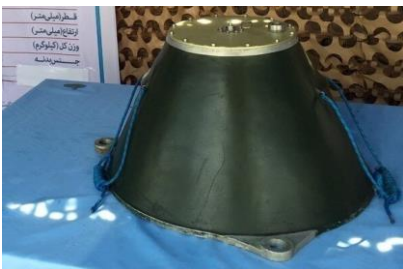
ระเบิดแสวงเครื่องนำพาโดยทางน้ำ (WBIED)

ภัยคุกคามต่อเรือ ได้แก่ อาวุธปล่อยนำวิถี (anti-ship missile) ขีปนาวุธนำวิถีต่อต้านเรือ (anti-ship ballistic) และระเบิดแสวงเครื่องนำพาโดยทางน้ำ 1 (water-borne improvised explosive devices: WBIED) และโดรน โดยมีทุ่นระเบิดอยู่ใกล้กับทางเข้าท่าเรือที่ถูกควบคุมโดยกบฏฮูตี ทุ่นระเบิดเหล่านั้นได้หลุดออกจากสายยึดเข้าไปในแผนแบ่งแนวจราจร (TSS) ทำให้มีความเสี่ยงในการเดินเรือ นอกจากนี้ยังมีรายงาน การใช้ยานใต้น้ำไร้คนขับ (Unmanned Underwater Vehicles : UUVs) แต่ไม่มีเรือลำใดถูกโจมตีโดยยานใต้น้ำไร้คนขับ ภัยคุกคามทางทะเลในปัจจุบันมีความรุนแรงมากขึ้นในพื้นที่ของกองกำลังฮูตี บริเวณใกล้กับแนวชายฝั่งทะเลแดงของเยเมน อย่างไรก็ตาม มีข้อสังเกตว่ากองกำลังฮูตีได้แสดงให้เห็นถึงความสามารถในการกำหนดเป้าหมายและโจมตีเรือในอ่าวเอเดนในระยะที่ไกลออกไปถึง 100 ไมล์ทะเลจากชายฝั่ง โดยเฉพาะอย่างยิ่งภัยคุกคามต่อเรืออิสราเอล สหราชอาณาจักร และสหรัฐอเมริกา ยังคงอยู่ในระดับสูง ซึ่งเจ้าของเรือ ผู้ปฏิบัติการ และลูกเรือทุกคนทราบดีว่า เรือของพวกเขาอาจเป็นเป้าหมาย และเกิดความเสี่ยงที่เรือจะเสียหายได้ในพื้นที่นี้